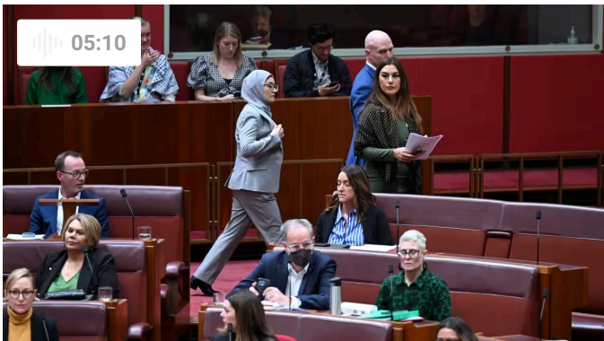
Lần đầu tiên chính trị gia Lao động rời khỏi hàng ngũ đảng mình tại Thượng viện kể từ những năm 1980