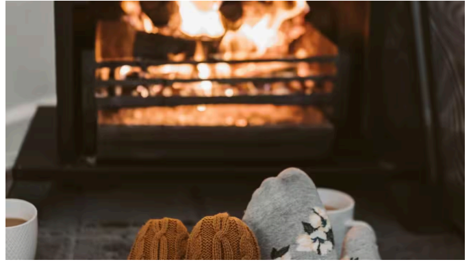
'Lạnh nhất mà tôi từng sống': Điều nhiều di dân cảm thấy khó khăn nhất khi sống ở Úc