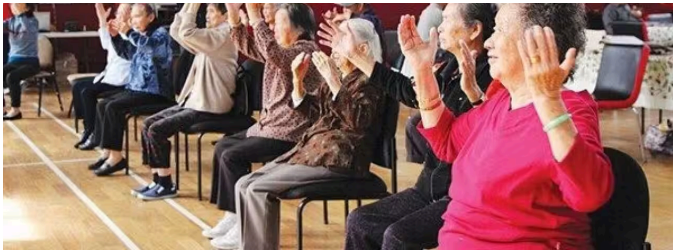
Cao Niên Vui Sống - Nên hay không nên vào Viện Dưỡng Lão?