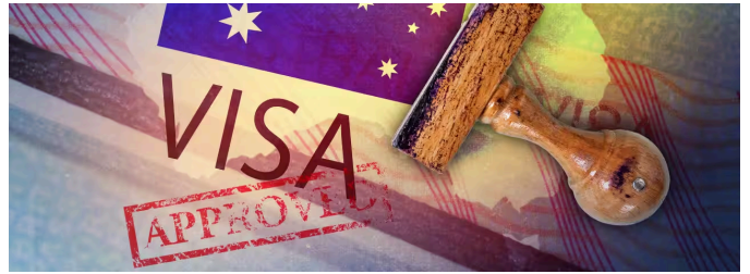
Hướng dẫn cho những thay đổi về Visa Úc năm 2024-25