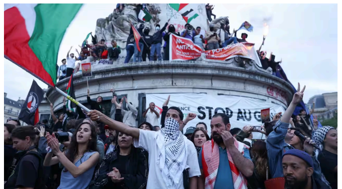
Bầu cử Pháp: Đảng Cực Hữu bị Liên Minh Cảnh Tả đẩy xuống hàng thứ 3 trong cuộc đua