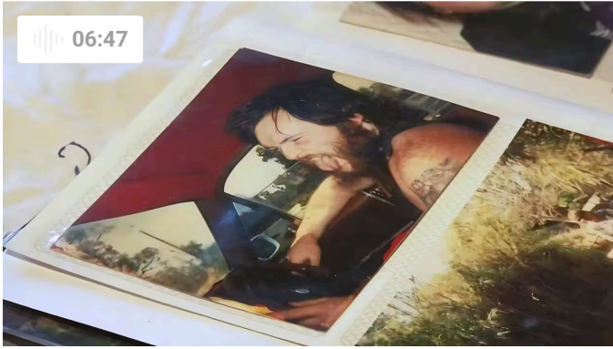
Người đàn ông sống 43 năm ở Úc, bị trục xuất về nơi không người thân thích