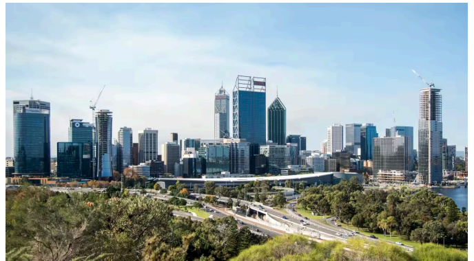
Giá thuê nhà tại thành phố này đã tăng gần 20% trong 12 tháng qua