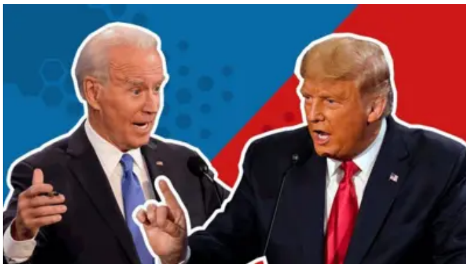
Sáu bang 'dao động' mang tính quyết định cho cuộc bầu cử Mỹ