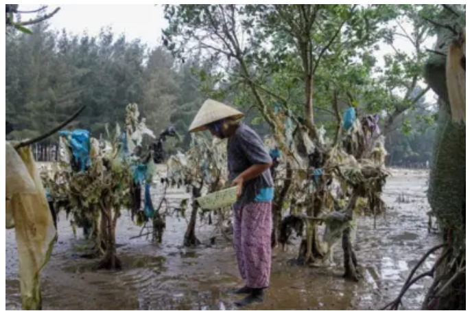
Người Việt Nam trong nhóm 'ăn nhựa' nhiều nhất thế giới