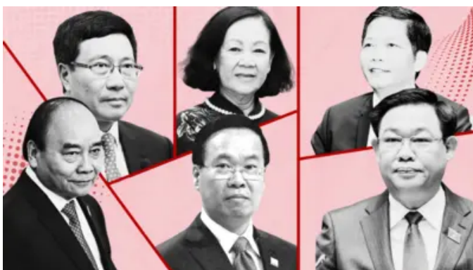
Bộ Chính trị ra quyết định mới về kỷ luật đảng viên cấp cao, cho thấy điều gì?