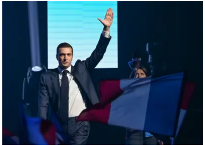
Người có thể trở thành thủ tướng Pháp ở tuổi 28 là ai?